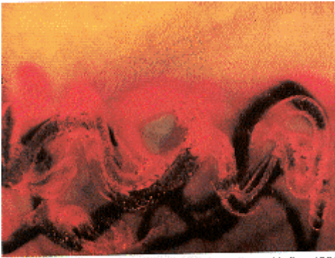
Otto Piene: Play with fire, 1981

Der Titel des Bildes "Play with fire" (1981) lässt sich auf dreifache Weise lesen: