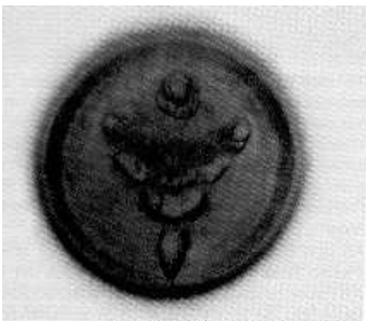
Otto Piene: Venus of Willendorf, 1963

In Goethes Prometheus-Gedicht erscheint der Titan als freier Künstler und Erfinder, der sich vom Althergebrachten nicht einschränken lässt. Otto Piene sucht auch ursprüngliche oder neue Erfahrungen und will gesellschaftlich festgelegte Grenzen expandieren. So hat er als Direktor des Center for Advanced Visual Studies (CAVS) am MIT den Lehrplan um die Fächer Telekommunikation, Laser, Video, Holographie, Sky Art und Umweltkunst erweitert und versucht, die Trennung zwischen Kunst und Technik zu überwinden. Otto Piene hat früh erkannt, dass wir in einer technisierten Welt leben und dass die Beherrschung der Technik zu den Faktoren unseres