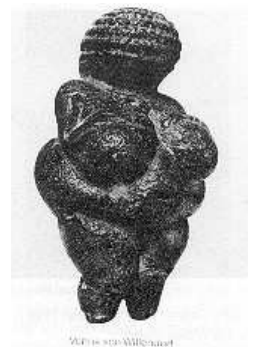
Otto Piene: Venus of Willendorf

Die Rauch- und Feuerbilder hat er im Grunde nicht mit dem Pinsel gemalt, sondern vom Feuer selbst malen lassen. Zum Vorschein kam u. a. ein Rauchgebilde, das mit der zentralen figurativen Form an steinzeitliche Fruchtbarkeitsstatuetten erinnert. Der Bildtitel „Venus of Willendorf“ (1963) spielt auf eine nur 11 cm große Kalksteinfigur, die sogenannte „Venus von Willendorf“ aus dem Jungpaläolithikum / Altsteinzeit an. Die Rauchspuren erinnern aber in ihrer Form ebenso an Terrakottafiguren z.B. an die sog. „Venus von Wisternitz“ (ca. 23000 v. Chr., Mähren, 11,5 cm, Terrakotta =gebrannte Erde). Hier wird die Anspielung auf die prähistorische Kultur insofern noch beziehungsreicher, als die kultischen Figuren aus Ton/Terrakotta gebrannt wurden. Die Rauchkunst Pienes scheint ebenso wie die Töpferkunst der Jungsteinzeit aus dem Feuer geboren und hat auf der Leinwand eine Rauchfiguration hervorgebracht. Der Vorgang verweist auf die Bedeutung des Feuers in der stammesgeschichtlichen und kulturellen Entwicklung des Menschen.