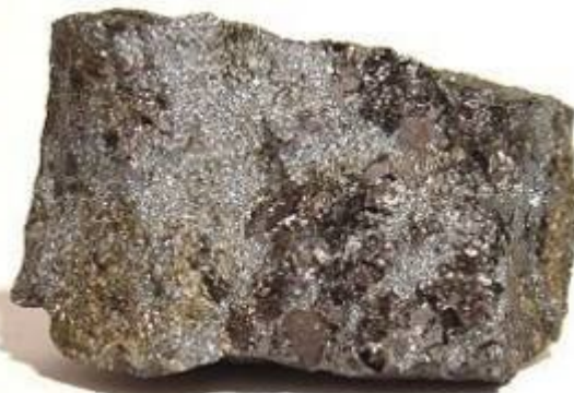
Arbeiten mit Kratze und Trog Hämatit