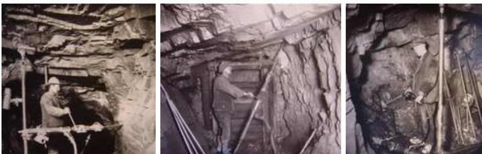
Arbeiten unter Tage.