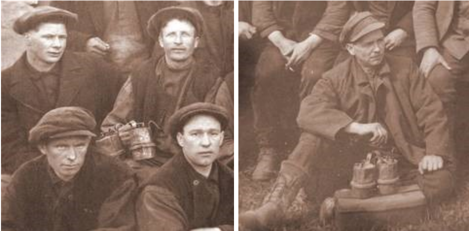
Deutlich sind auf den Fotos Bergmänner mit ANRIK - Lampen zu sehen.