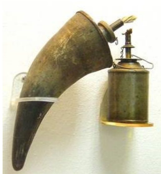
ANRIK - Karbidlampe, Ölhorn - Lampe, Öllampe Modell Norberg