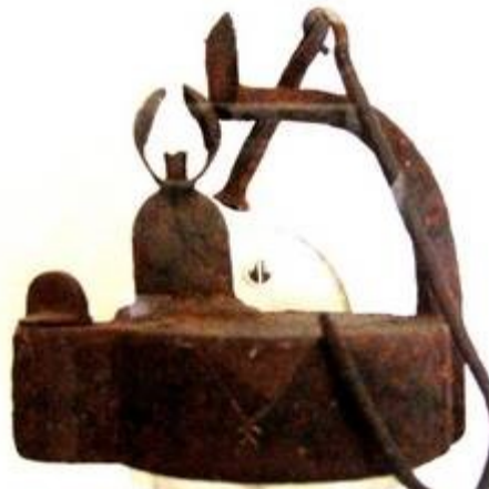
Malm Froschlampe wie ein Modell aus der Zinkgruva