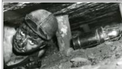
Pechkohlebergbau in Bayern