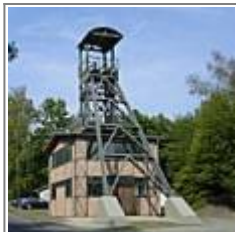
Bergbau im Siegerland