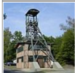
Pechkohlebergbau in Bayern Bergbau im Siegerland