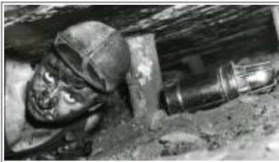
Pechkohlebergbau in Bayern