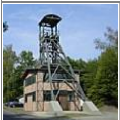
Bergbau im Siegerland